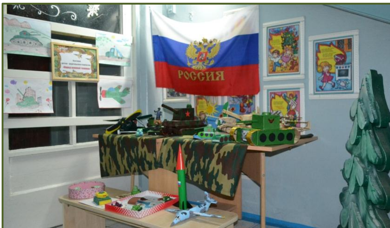
Выставка детско - родительского творчества «Парад военной техники»